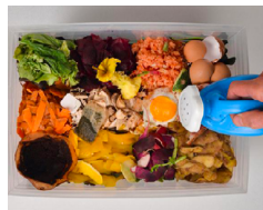
ILLUSTRATION : COMPOSTAGE