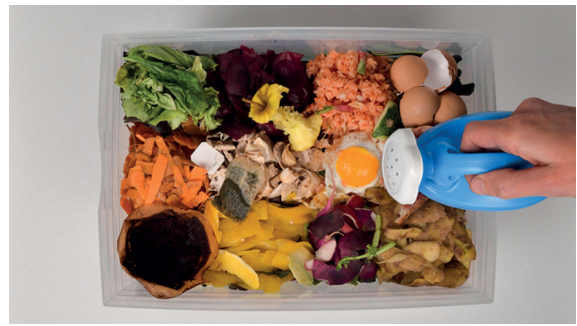
ILLUSTRATION : COMPOSTAGE