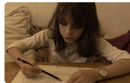
Espace d'Eléonor Gilbert France • 2014 • 15'

Une petite fille essaie de comprendre pourquoi son petit frère n'est pas vraiment comme les autres enfants.