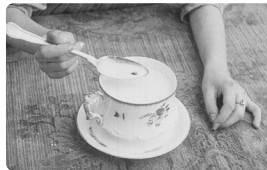
Craignez la mouche de Jean Comandon France • 1917 • 1'

La mouche est un danger pour l'homme. L'observation au microscope et à l'ultramicroscope confirme qu'il faut combattre ce diptère.