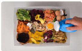
Illustration : compostage d'Élise Auffray France • 2014 • 3'