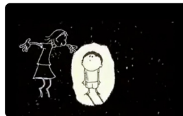
Mon petit frère de la lune de Frédéric Philibert France • 2008 • 6'

La mouche est un danger pour l'homme. L'observation au microscope et à l'ultramicroscope confirme qu'il faut combattre ce diptère.