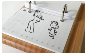
L'Effet de mes rides de Claude Delafosse France • 2022 • 12'

Fabriquer son compost, c'est faire pousser de la terre, c'est faire pousser de la vie. C'est l'histoire du temps qui passe et qui transforme un monde qui meurt en un autre nouveau, présent, futur et fécond.